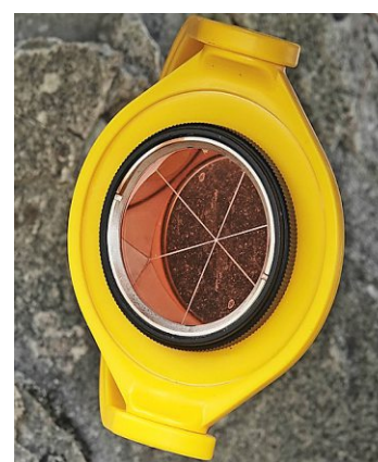
Einer der zwanzig Messspiegel.

zwanzig Messspiegel im Gelände von einem Tachymeter automatisch jede halbe Stunde gemessen und die Daten an die Geologen von der Geotest AG übermittelt. Da bei Nebel oder Starkregen keine Messungen durchgeführt werden können, senden zusätzlich sieben GPS-Stationen im Gelände stündlich