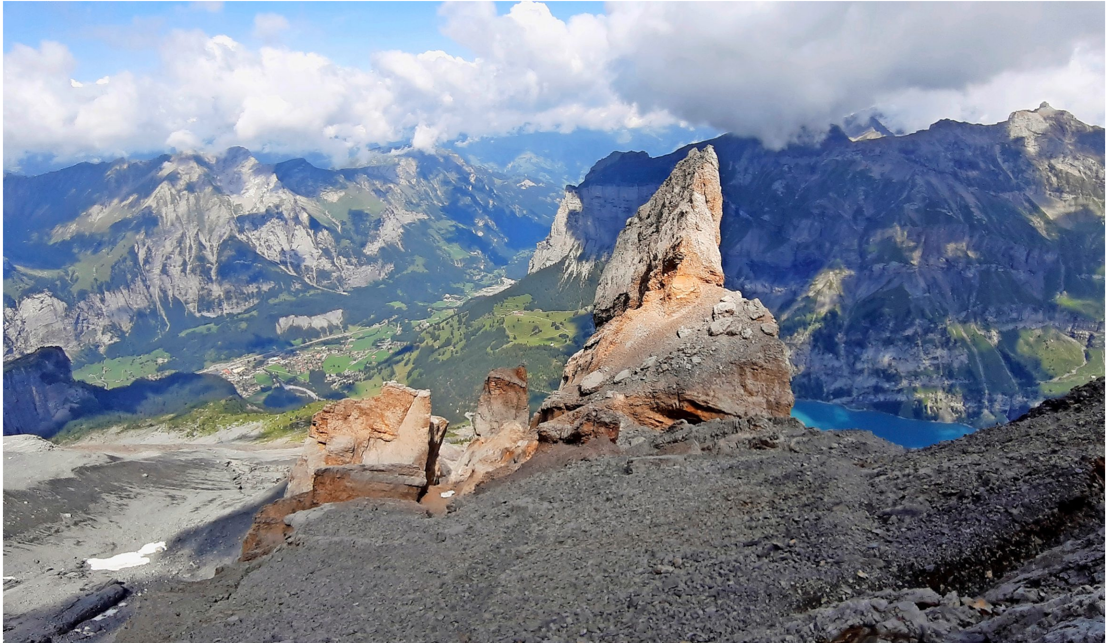
Der rutschende Spitze Stein von oben herab gesehen. Im Hintergrund links ist 1600 Höhenmeter weiter unten Kandersteg zu sehen, rechts der Oeschinensee.

Kandersteg Seit über einem Jahr wird der Spitze Stein hoch über dem Oeschinensee mittels technischer Vermessung rund um die Uhr überwacht. Der markante Felsen und ein Teil des Berghanges darunter rutschten in dieser Zeit um 3 Meter ab.